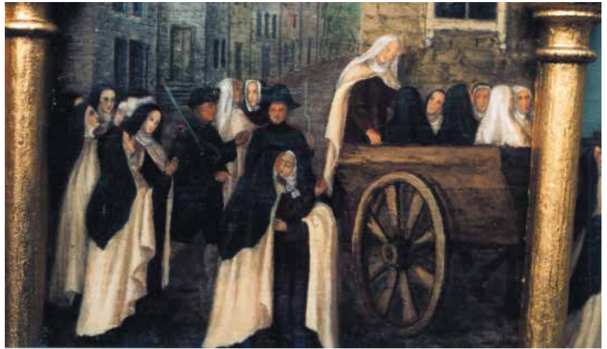
— Les bienheureuses carmélites de Compiègne, huile sur bois – 1905. Détail : La montée en charrettes et les adieux aux bénédictines. Reliquaire des bénédictines de Stanbroock (GB).

Fondé en 1641, bénéficiant jusqu'à la Révolution de la protection des reines de France, d'Anne d'Autriche à Marie-Antoinette, le carmel de Compiègne compte vingt et une membres en 1790. La plupart sont d'origine extérieure et de bonne famille, telle Madame Philippe, fille naturelle du prince de Conti.