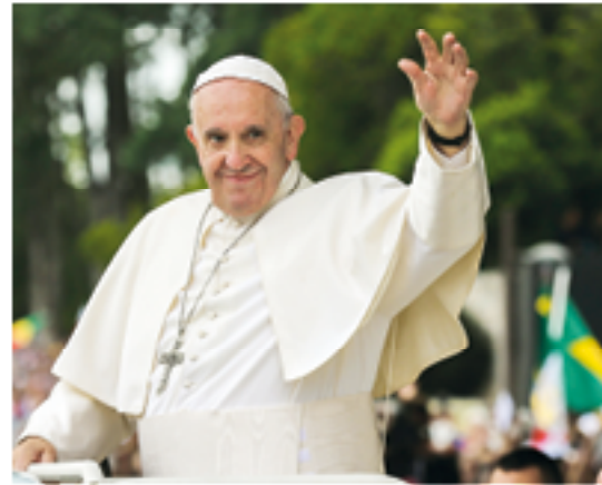
Le pape François à Fatima (Portugal), en 2017.

Bien souvent, nous sommes émerveillés par la beauté qu'offre la Terre. Mais savons-nous encore la regarder ? Savons-nous la partager ? Saurons-nous la transmettre ? La nature nous trans-