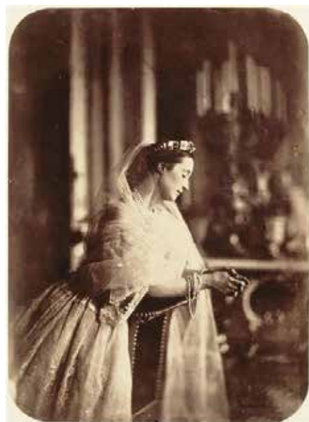
Le Gray Gustave (1820-1884). L'impératrice Eugénie agenouillée sur un prie-Dieu... Musées et domaine nationaux du Château de Compiègne.