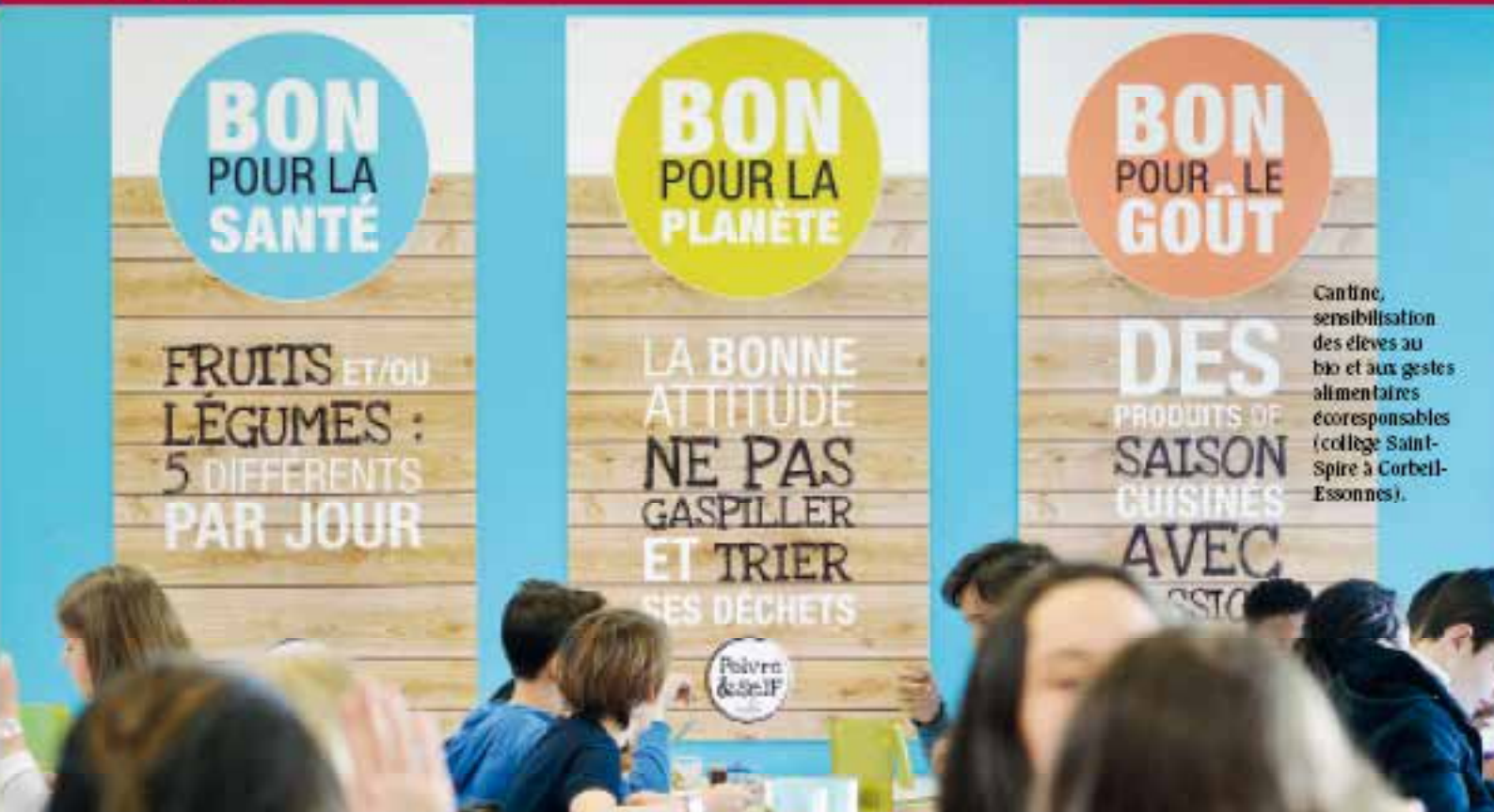
Cantine, sensibilisation des élèves au bio et aux gestes alimentaires écoresponsables (collège Saint-Spire à Corbeil-Essonnes).