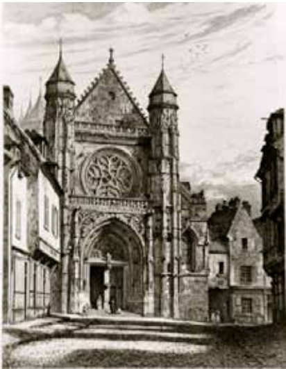
Église Saint-Antoine – gravure ancienne.

Les seize «bienheureuses» carmélites de Compiègne figurent parmi les plus célèbres victimes du dramatique conflit survenu entre l'Église catholique et la Révolution dans sa phase radicale, la grande Terreur. Même si l'affaire, peu représentative de la décennie révolutionnaire à Compiègne, est en réalité plus parisienne que locale.