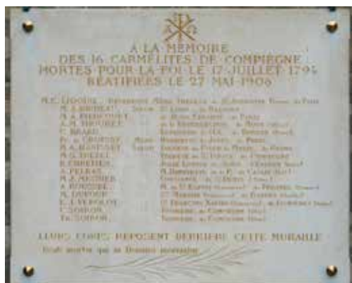
— Plaque du cimetière de Picpus, redorée en 2019.

L'ordre de perquisition de ce dernier, du 21 juin 1794, est promptement exécuté par le comité révolutionnaire de Compiègne apeuré. Quelques écrits et objets compromettants justifient l'arrestation des seize religieuses et de leur correspondant Mulot, puis leur transfert à Paris.