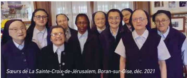
Sœurs de La Sainte-Croix-de-Jérusalem, Boran-sur-Oise, déc. 2021