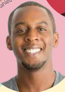
Charles de Foucauld