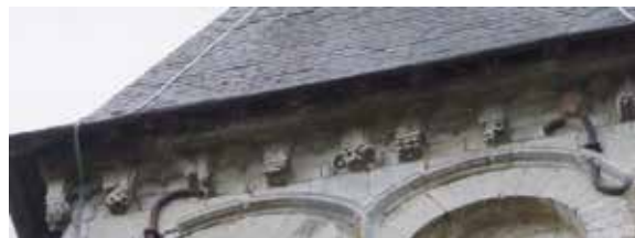
Les modillons de la corniche beauvaisienne du clocher.