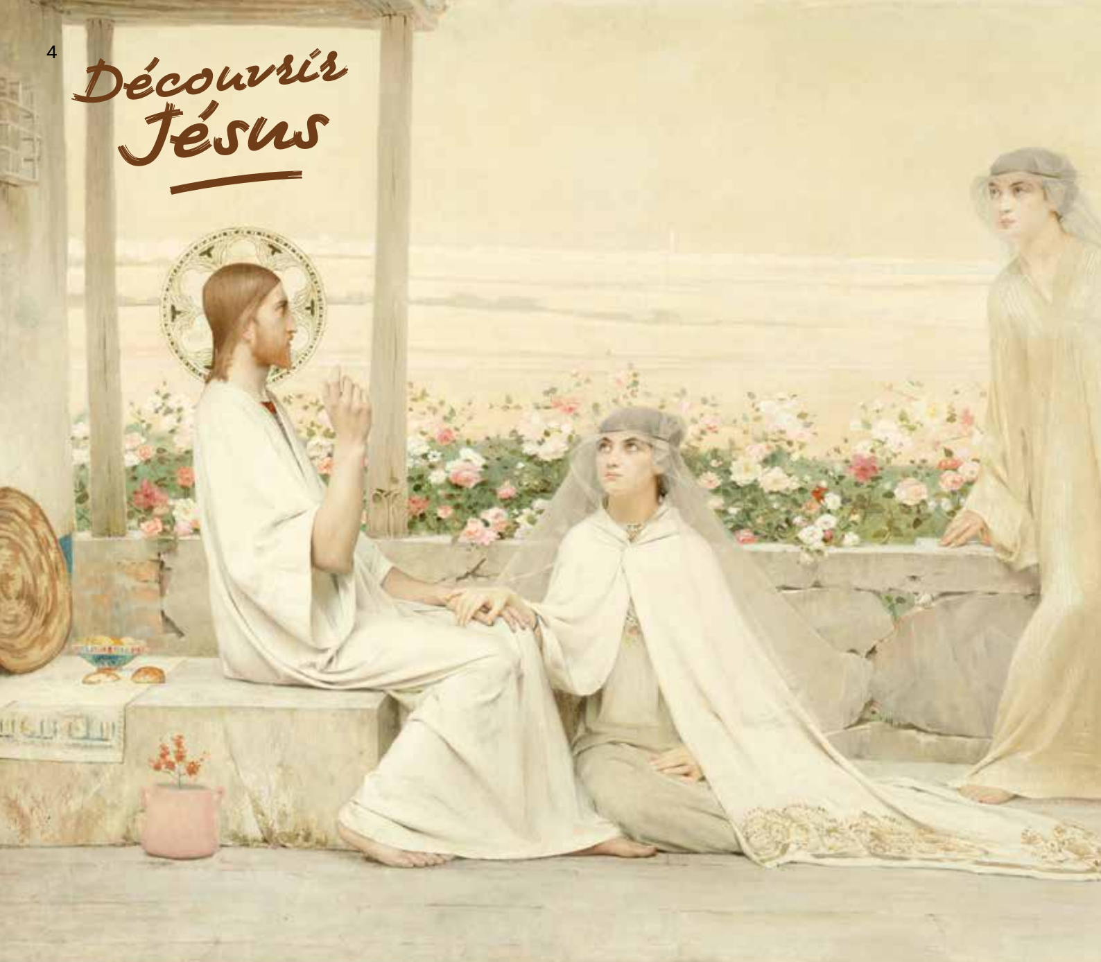
«Le Christ chez Marthe et Marie» d'Eugène Delacroix (1826). Musée des Beaux-Arts de la ville de Paris.