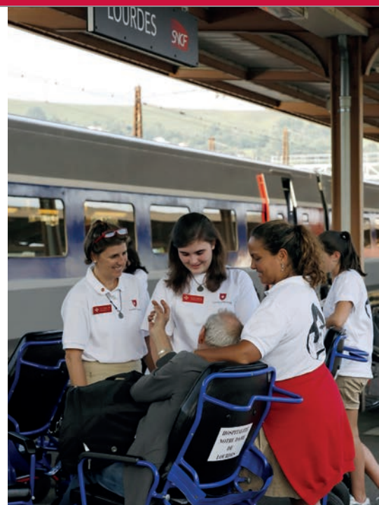
Lors d'un pèlerinage, arrivée des pèlerins à la gare de Lourdes.