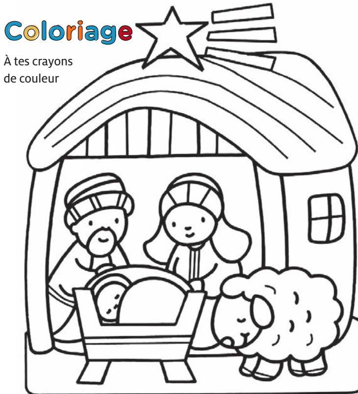
À tes crayons de couleur