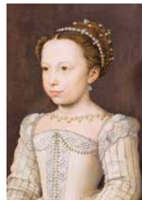
Un portrait de Clouet.