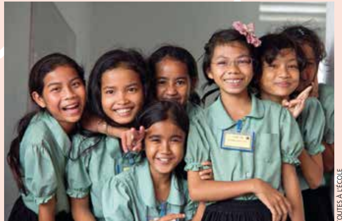
TOUTES À L'ÉCOLE

Chez nous, la rentrée sera commentée, disputée, critiquée. N'est-ce pas là, une liberté que beaucoup de par le monde nous envient ? Chacun de nous vivra ce moment à sa façon. Que pensera la vieille dame, derrière sa fenêtre, à la vue des écoliers sur le chemin de leur école ? Devinera-t-elle la présence de la petite Syrienne ou du petit Ukrainien ? Ce soir, qui sortira vainqueur de cette difficile négociation : devoir de maths ou de français contre jeu vidéo ? Que pourra bien dire cette petite sœur, portable collé à l'oreille, à sa grande sœur entrée à l'université ? Comment ce couple gèrera-t-il le silence de cette maison devenue bien vide ? Avec, en mémoire, l'image du sourire de ces petits Africains assis à même le sol, montrant fièrement leur ardoise usagée, quelles pensées aura ce professeur face à ses élèves ?... La vie n'est-elle pas le recueil de nos quotidiens ?... Alors, nous vous souhaitons que cette rentrée se passe de la meilleure des façons possibles.