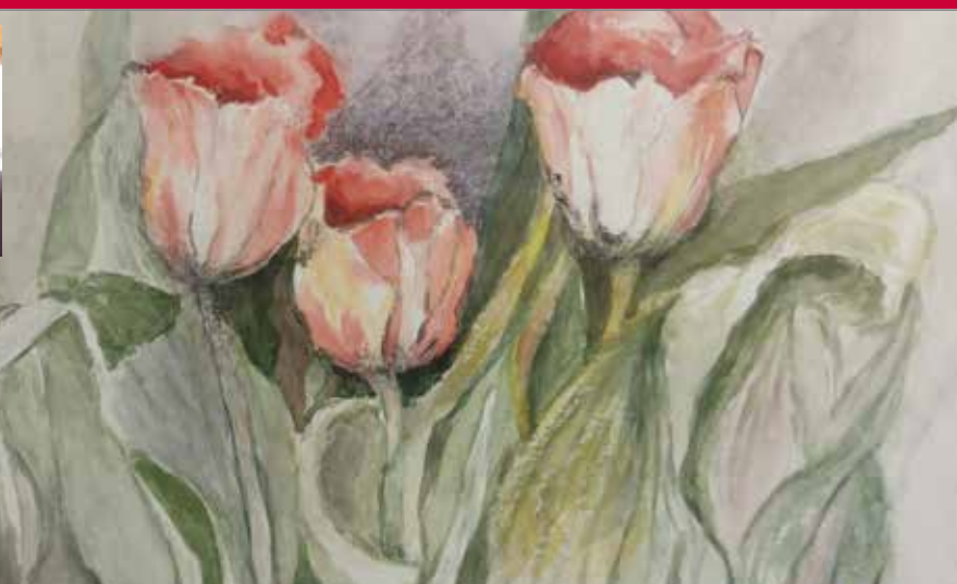
Détail d'une aquarelle de Daniel Fournier ; en médaillon, l'artiste qui nous a quittés.