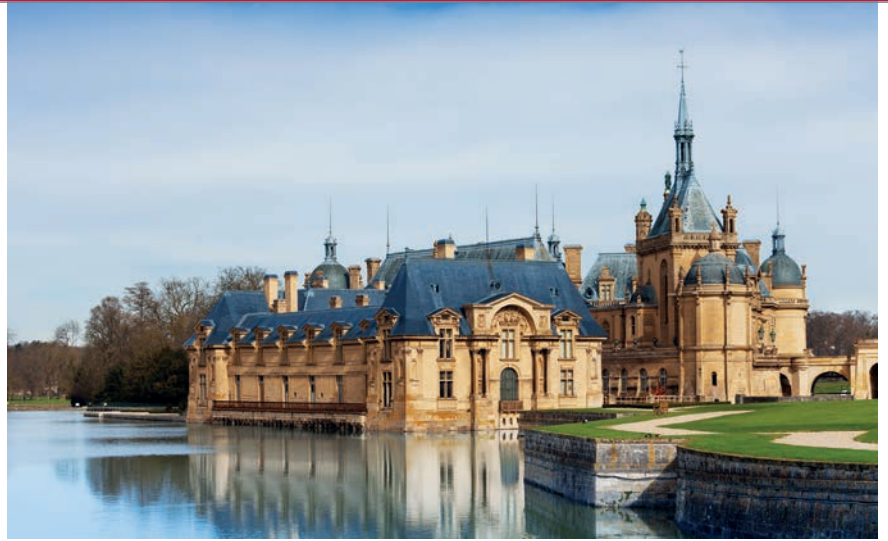
Château du domaine de Chantilly.