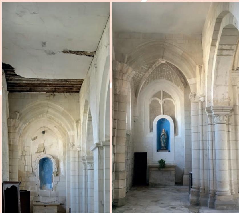
L'intérieur de l'église : avant et après, la restauration.

Une fête villageoise sera organisée lors des Journées du patrimoine, samedi 18 et dimanche 19 septembre , pour permettre aux habitants de refaire connaissance avec les différents bâtiments restaurés; tout d'abord l'église bien sûr, mais aussi la tour.