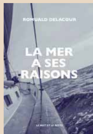
La mer a ses raisons de Romuald Delacour, aux éditions Le mot et le reste (2022)