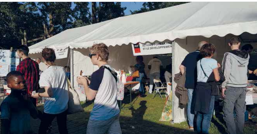
Visite des stands lors de la fête des associations en 2019.