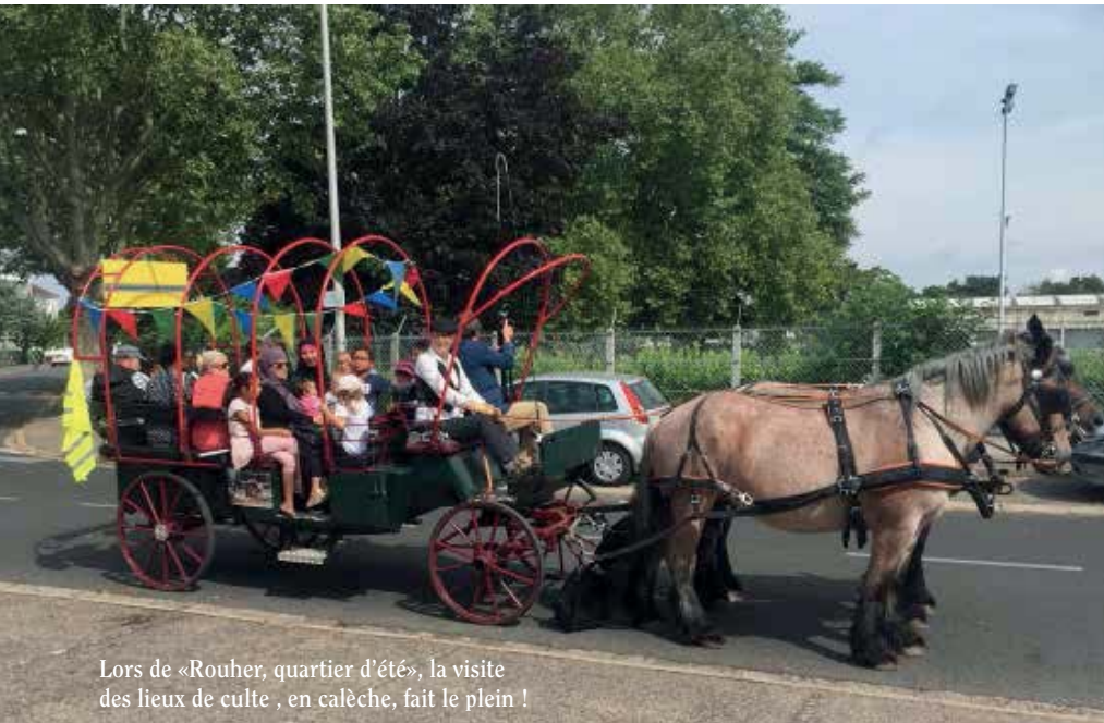
Lors de «Rouher, quartier d'été», la visite des lieux de culte, en calèche, fait le plein !