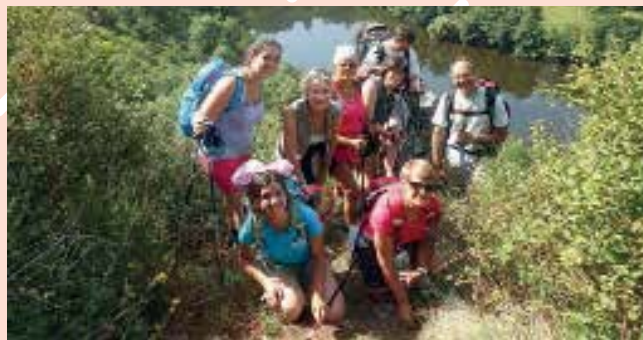
Groupe en chemin lors du pèlerinage à Saint-Jacques