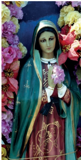
Notre-Dame de Guadalupe, Mexico.