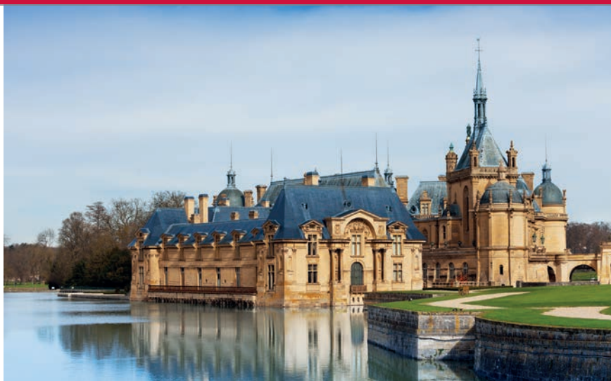
Château du domaine de Chantilly.