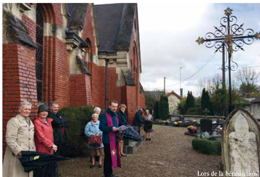
Lors de la bénédiction.