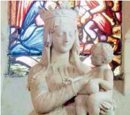
Vierge à l'Enfant, Saint-Vaast, Boran-sur-Oise.