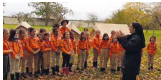
Accueil des louveteaux.