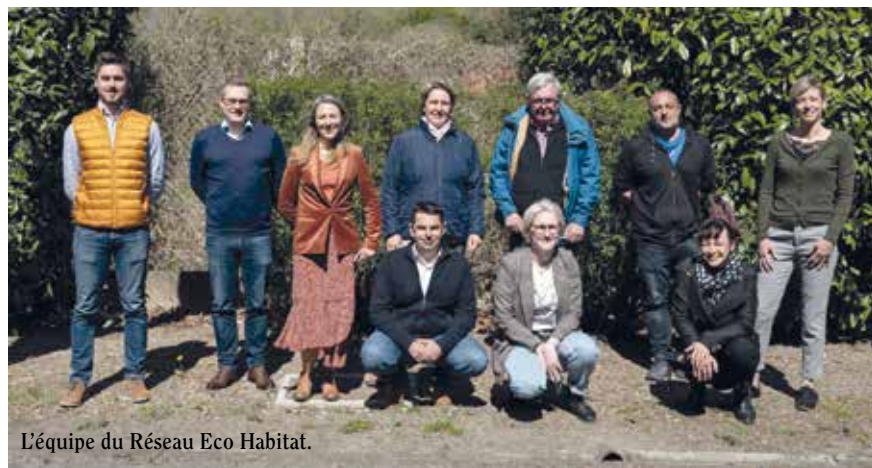
L'équipe du Réseau Eco Habitat.