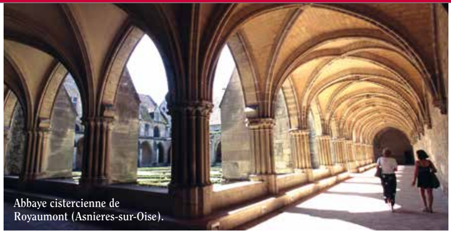
Abbaye cistercienne de Royaumont (Asnières-sur-Oise).

France Mémoire a été créé en 2021 par l'Institut de France en remplacement de l'ancien service des Commémorations nationales qui dépendait du ministère de la Culture. En effet, plusieurs crises avaient révélé l'inconvénient de maintenir une mission aussi sensible sous l'autorité directe du gouvernement. À deux reprises, en 2011 et en 2018, le ministre avait annulé tout le travail préparé par les historiens. Aujourd'hui placées, si l'on peut dire, «à l'abri» de la coupole du quai Conti, les commémorations échappent désormais aux aléas de la politique. Bien sûr, l'État continue d'avoir sa propre politique mémorielle, ce qui est légitime. Mais l'Institut étant indépendant, les Français ne peuvent plus craindre que le pouvoir politique leur dicte une histoire officielle par le biais des commémorations. Ainsi, France Mémoire a pour mission, au niveau national, d'attirer l'attention sur les grands anniversaires de l'histoire de France et de diffuser largement des connaissances historiques.