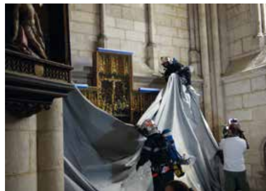
Les pompiers du SDIS60 lors de l'exercice du 11 juin.

Dans le cas des églises comme de la majorité des biens culturels à protéger, le nouvel outil numérique permettra aux collectivités et associations paroissiales de répertorier facilement, avec une tablette ou un smartphone, les objets liturgiques et les œuvres remarquables, et d'indiquer, dans le respect des règles de sûreté, les consignes aux services de secours (24h/24h). N'hésitez pas à en