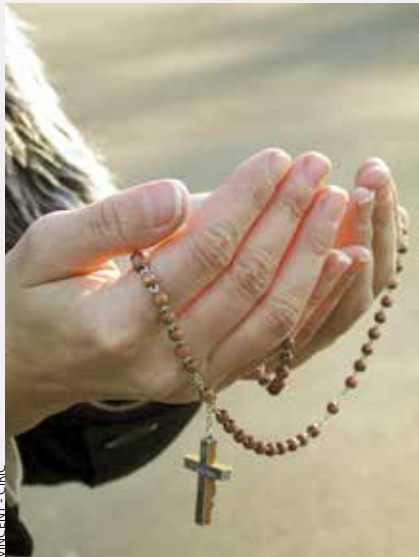
VINCENT - CIRIC

Pour trouver ou créer une équipe du rosaire , vous pouvez vous adresser à votre curé ou à Marie Dubreuil, 03 44 59 02 14. Pour créer une équipe, il suffit de trois ou quatre personnes qui désirent méditer, prier et partager; et puis d'ouvrir à tour de rôle sa maison pour accueillir les membres de l'équipe.