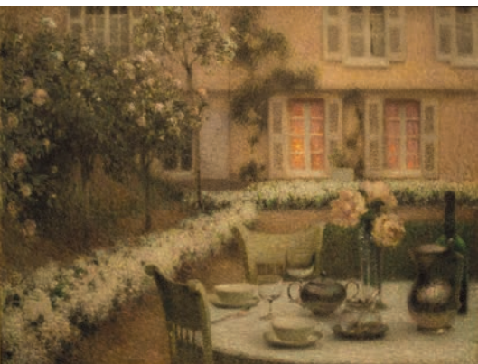
La table dans le jardin blanc de Gerberoy (1900, musée des beaux-arts de Gand).