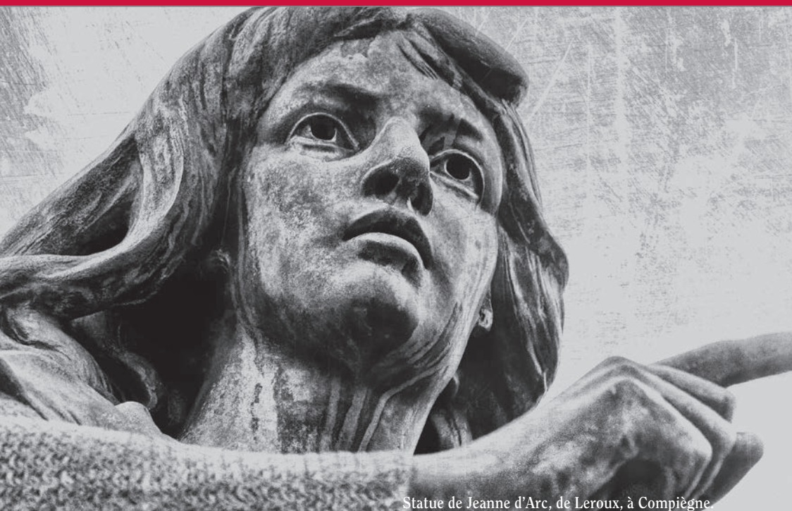
Statue de Jeanne d'Arc, de Leroux, à Compiègne