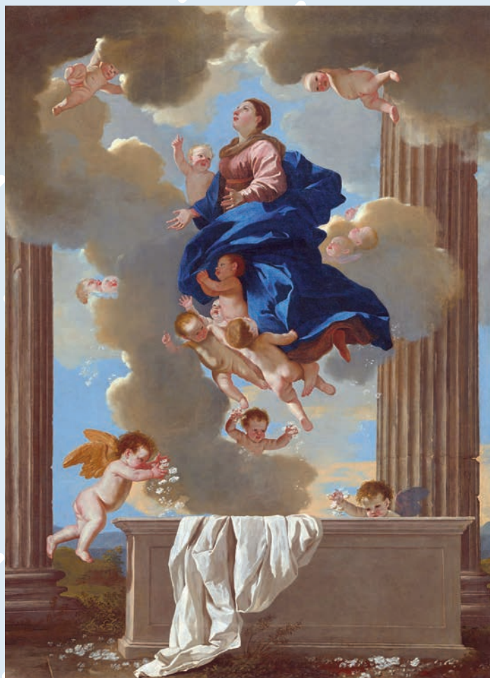
L'Assomption de la Vierge de Nicolas Poussin, 1630-1632 (Galerie nationale, Washington).

On associe souvent l'Assomption de Marie avec l'Ascension du Christ ; de fait, les mots se ressemblent et il y a, dans les deux cas, une montée mystérieuse au ciel dans la gloire de Dieu. Cependant, l'«Assomption» vient du latin « assumere » (assumer, enlever) et non du terme « ascendere » (monter, s'élever, qui a donné «Ascension»). Son étymologie souligne l'initiative divine : Marie ne s'élève pas toute seule vers le ciel, c'est Dieu qui fait le choix de l'«assumer», corps et âme, en la réunissant à son Fils sans attendre la résurrection finale, tant elle a su s'unir, corps et âme, à lui dès sa vie terrestre. Dans le sillage de l'Ascension, Marie inaugure le destin ouvert aux hommes par la résurrection de son Fils et anticipe ce qui deviendra la condition des sauvés à la fin des temps.