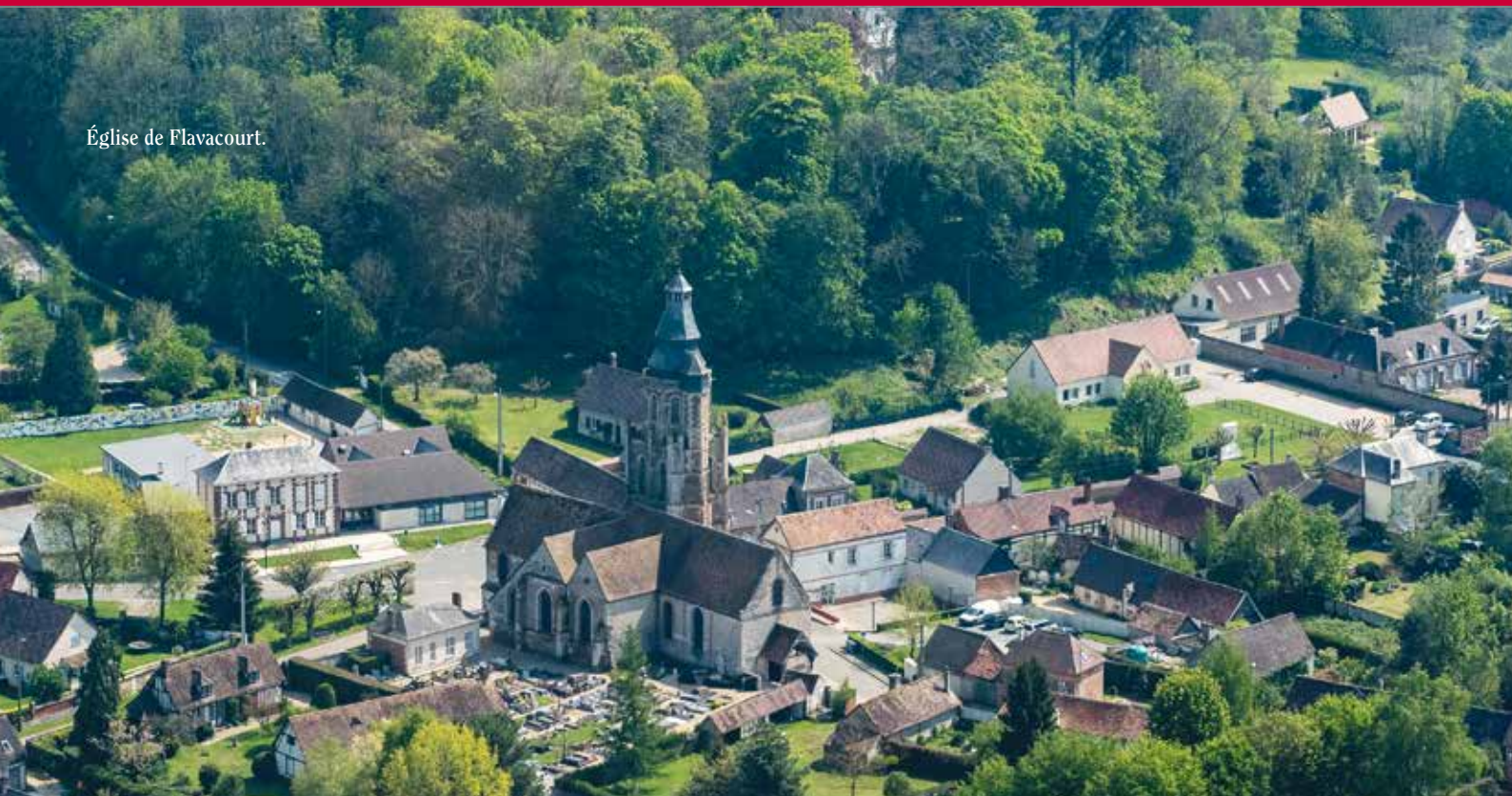
Église de Flavacourt.