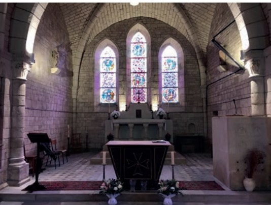
Autel de l'église d'Etavigny.