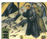
Éloi Leclerc Sagesse d'un pauvre

Ce privilège qui concerne la Vierge Marie – être tout entière, corps et âme, conduite à entrer dans la gloire du ciel – est un signe d'espérance pour chacun de nous ; il nous permet de découvrir ce qu'est le but de notre pèlerinage terrestre. L'Assomption met en valeur une dimension essentielle de la foi chrétienne : à l'école de Marie, accueillir le don de Dieu dans sa vie, célébrer cette grâce qui élève les humbles et rabaisse les puissants.