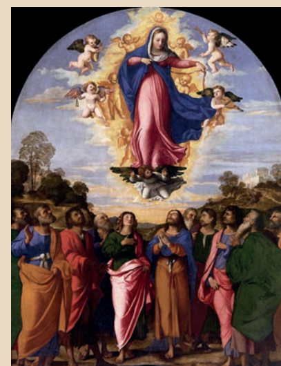
Assomption de Palma il Vecchio. (galerie de l'Académie, Florence).