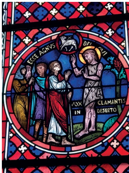
Vitrail de l'église d'Etavigny.

Chaque 1 er samedi du mois, de 10h à 12h, les églises de Betz, Lévig-en, Mareuil-sur-Ourcq, Etavigny et Rosoy-en-Multien sont ouvertes afin de permettre aux fidèles de prier la Vierge Marie et faire une visite au Saint Sacrement. Cette visite consiste à se tenir un instant devant le Seigneur, en silence, ou avec le soutien d'une prière pour lui dire notre foi en sa présence. «Tandis qu'enfermé dans une faible hostie, le Sauveur semble dormir du sommeil de l'impuissance, son Cœur veille. Je dors, mais mon Cœur veille. Il veille quand nous pensons à lui et quand nous n'y pensons pas. Il n'a pas de repos : il jette vers son Père ses cris de pardon en notre faveur.