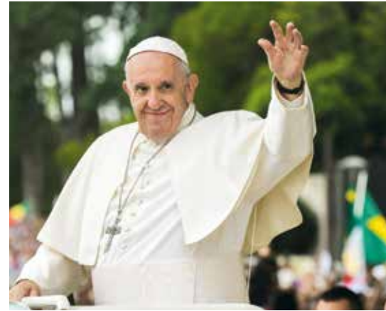
Le pape François à Fatima (Portugal), en 2017.

Bien souvent, nous sommes émerveillés par la beauté qu'offre la Terre. Mais savons-nous encore la regarder? Savons-nous la partager? Saurons-nous la transmettre? La nature nous trans-