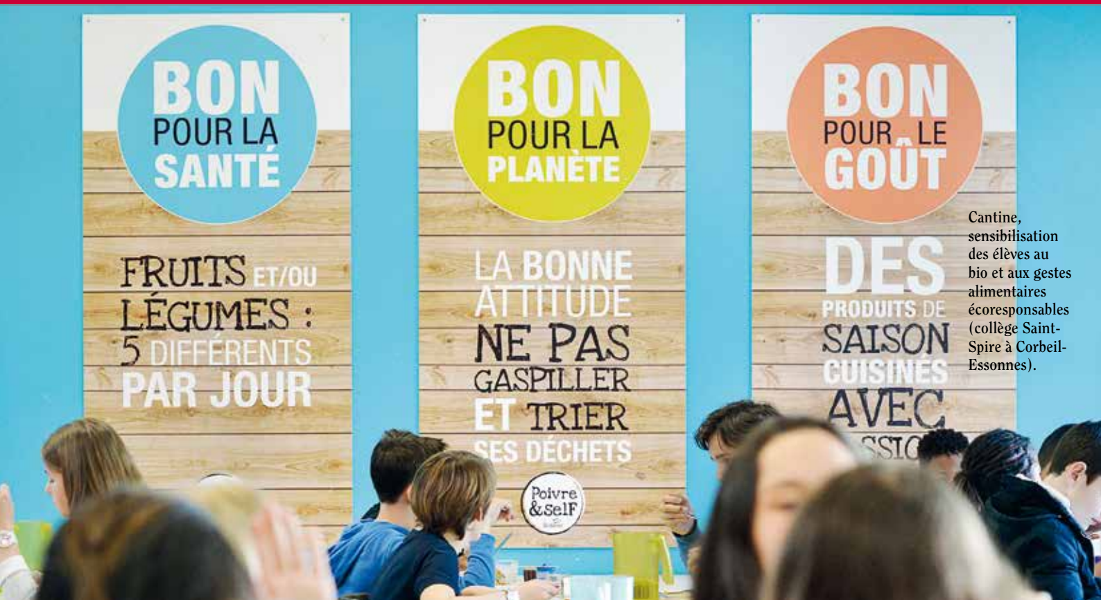
Cantine, sensibilisation des élèves au bio et aux gestes alimentaires écoresponsables (collège Saint-Spire à Corbeil-Essonnes).